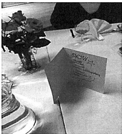
Nobellunch med 3 rätter

Fyra volontärer har tillsammans ansvarat för arrangementet som också haft olika teman. Se bilaga 4 – Mat och Prat 2015