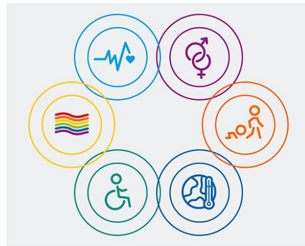
Tvärpolitiska områden som berör folkhälsopolitiken