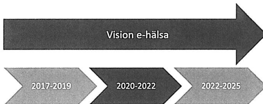
Figur 1. Tidslinje för visionen och tillhörande dokument.

Parterna, dvs. staten och SKR, bedömer att Vision e-hälsa även fortsättningsvis ska vara utgångspunkten för gemensamma insatser och att det samarbete som gjorts under 2017–2019 ska fortsätta samt utvecklas. Föreliggande dokument, som täcker 2020–2022, anger den strategiska inriktningen för arbetet under de kommande åren.