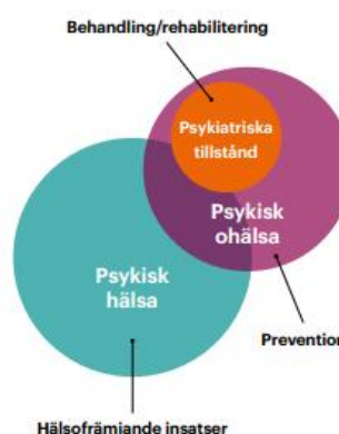
Figur 3. Förhållande mellan psykisk hälsa, psykisk ohälsa och psykiatriska tillstånd samt hur de är relaterade till olika insatsnivåer.

För att snabbare få hjälp när man har psykisk ohälsa föreslår folkhälsomyndigheten att första linjens psykiatri behöver stärkas, för att kunna möta behovet så snabbt som möjligt. En bra samverkan mellan flera aktörer är viktigt för att kunna stötta på de områden som behövs utifrån individens behov. Många gånger behöver stödet vara mångfacetterat för att också fånga spridningseffekter där ett problem med den psykiska hälsan orsakar ett annat, exempelvis när problem hemma ger dålig sömn eller aggressivitet utbrott som påverkar skolresultat och socialt samvaro. Det är komplext och här behövs insatser och samverkan mellan en mängd aktörer till exempel barnhälsovård, hälso- och sjukvård, förskola, skola, tandvård, socialtjänst, civilsamhället och näringslivet. Det gäller självfallet inte bara när det gäller psykisk ohälsa utan är minst lika viktigt i det hälsöfrämjande arbetet som präglas av att skapa och bredda förutsättningar för individen att upprätthålla sin hälsa.