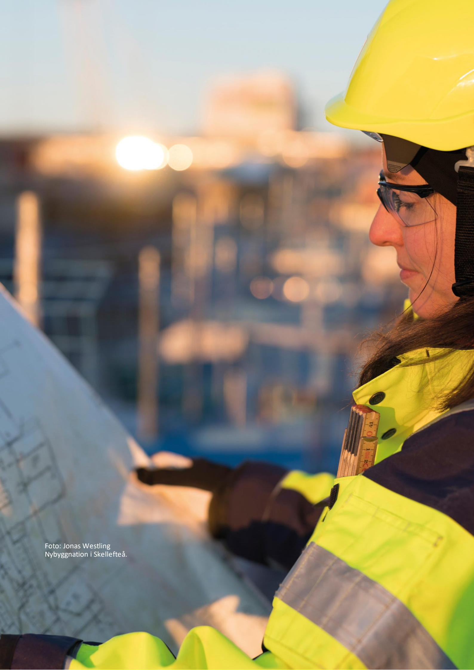
Nybyggnation i Skellefteå.