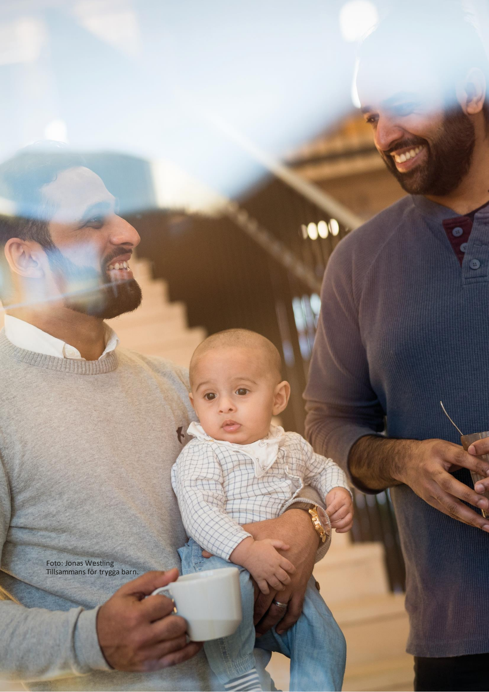
Tillsammans för trygga barn.