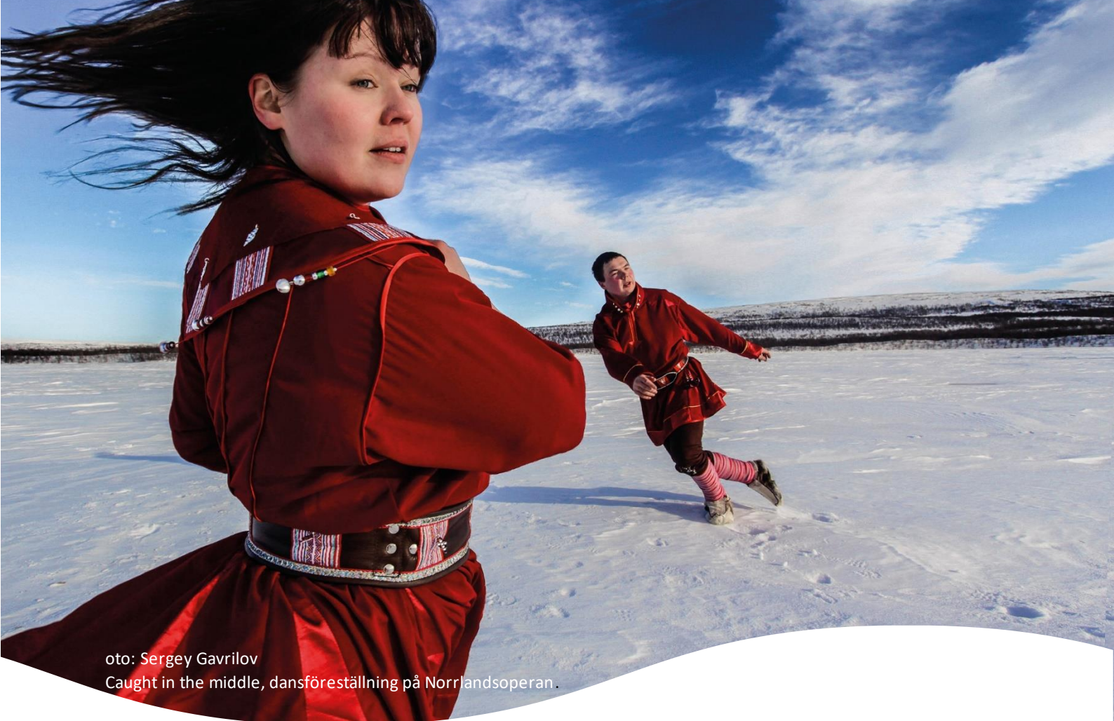
Caught in the middle, dansföreställning på Norrlandsoperan.