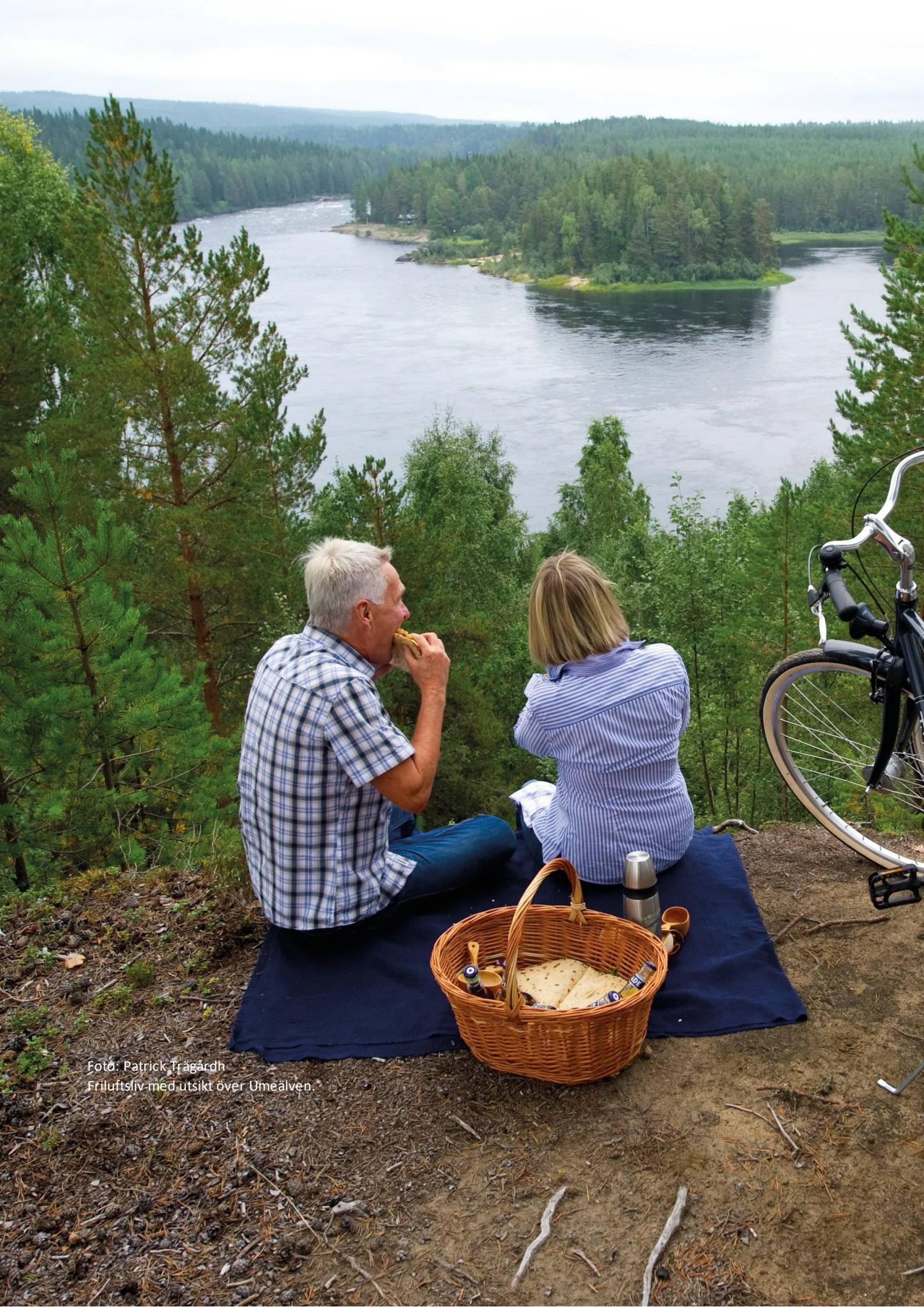
Friluftsliv med utsikt över Umeälven.