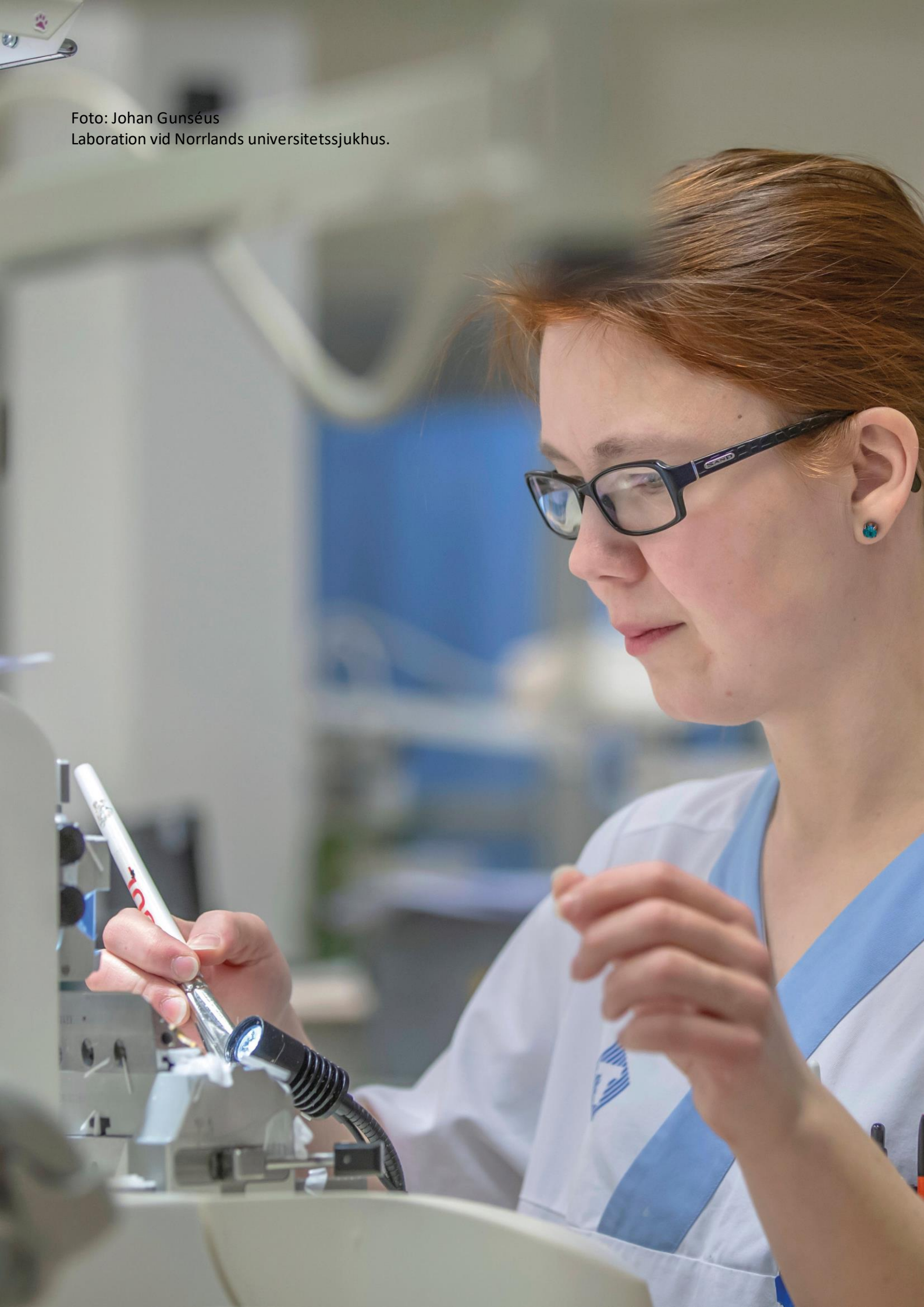
Laboration vid Norrlands universitetssjukhus.