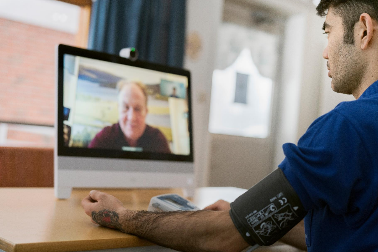
Hälsorummet i Bastuträsk.