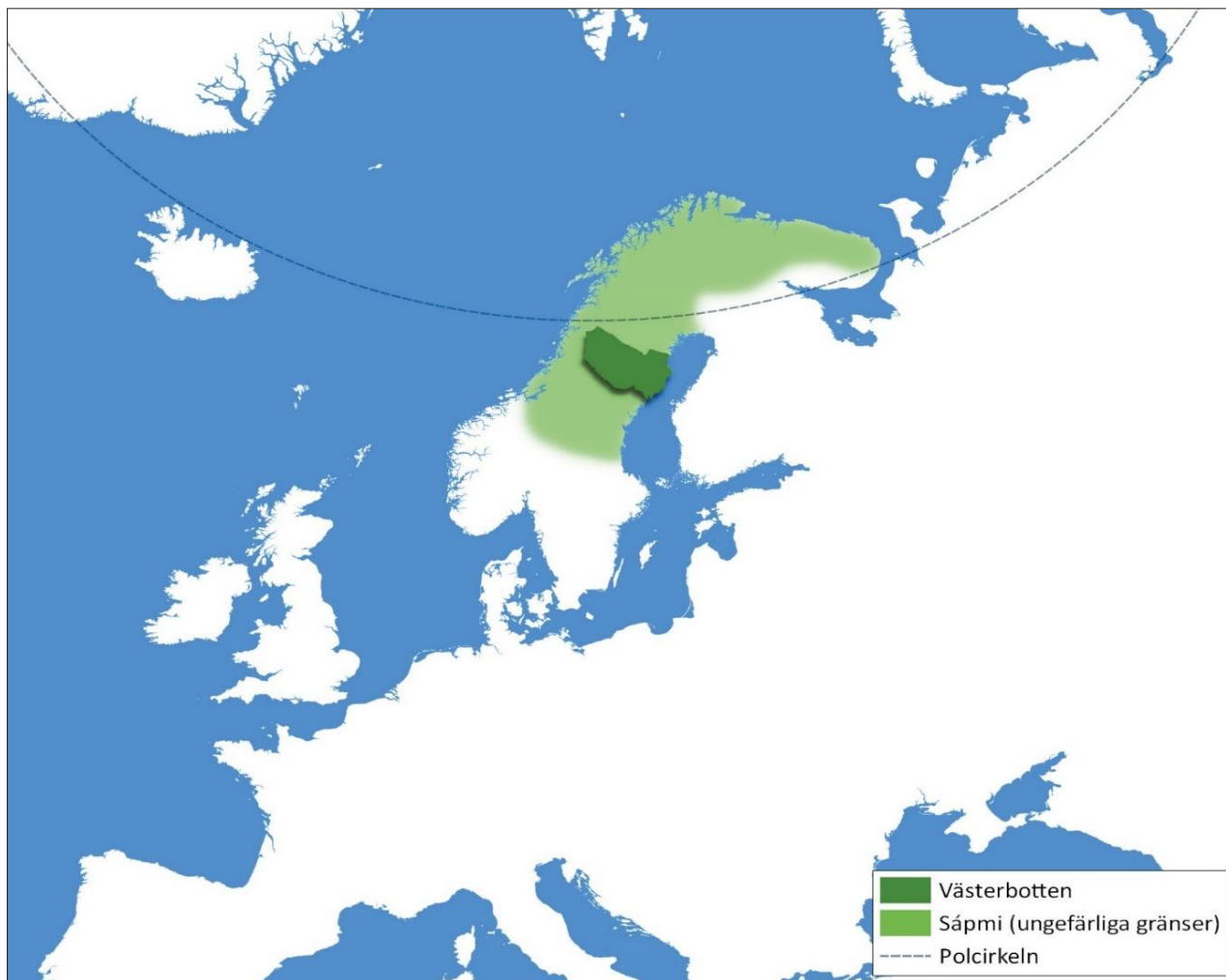
Västerbottens län - den geografiska platsen för strategin (kartan kommer att uppdateras)

Älvar, berg, vägar och järnvägar har historiskt format hur samhällen vuxit fram. Platser med god tillgång till resurser, kompetens och kommunikationer har tillväxtfördelar, men även mindre platser i länet växer genom lokal drivkraft.