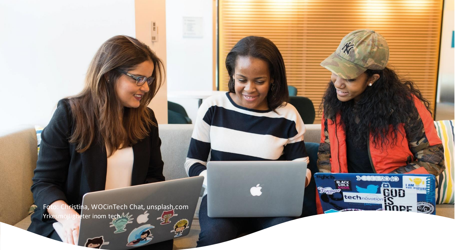
Yrkesmöjligheter inom tech.