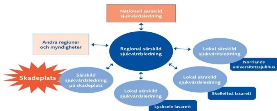
Bild hämtad från regionens Plan för kris- och katastrofmedicinsk beredskap 2018-2022

Illustrationen nedan tydliggör även ledningsnivåerna vid en särskild händelse: