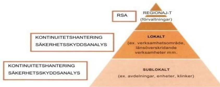
Bild hämtat från Risk- och sårbarhetsanalys

I RSA identifieras samhällsviktig verksamhet, kontinuitetshanteringen ska på en mer detaljerad operativ nivå identifiera de beroenden och förmågor som en viss verksamhet/funktion har. Åtgärdsförslag tas fram för att verksamheten ska kunna upprätthållas oavsett vad som inträffar, som i sin tur resulterar i avbrottsplaner/reservrutiner och tekniska åtgärder. Vi har tagit del av en plan för utveckling och genomförande av kontinuitetshanteringen, planen är inte fastställd av styrelse eller nämnd men har enligt intervjupersoner förankrats i ledningsgrupp. Planen utgår från bland annat styrelsens och nämndens RSA och anger vilka verksamheter som ska arbeta med kontinuitetshandling och krigsorganisation under mandatperioden. Det framgår bland annat att Läkemedelscentrum, Hjälpmedelscentrum, Primärvård och Ambulans ska kontinuitetshandla under 2024 och att Läkemedelscentrum, Hjälpmedelscentrum och lokal särskild sjukvårdsledning har helt eller delvis genomfört kontinuitetshandling under 22/23.