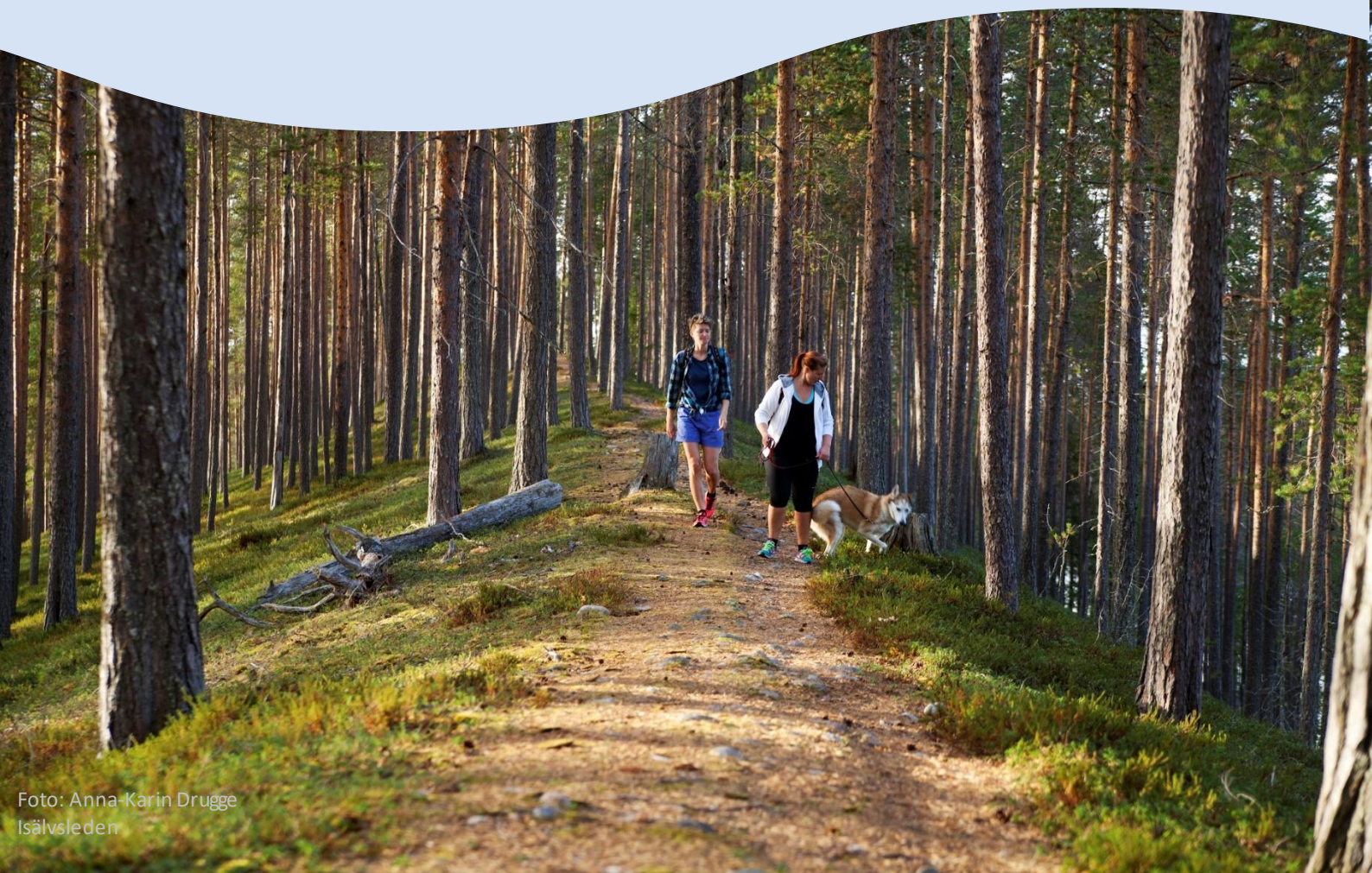
Isälvsleden