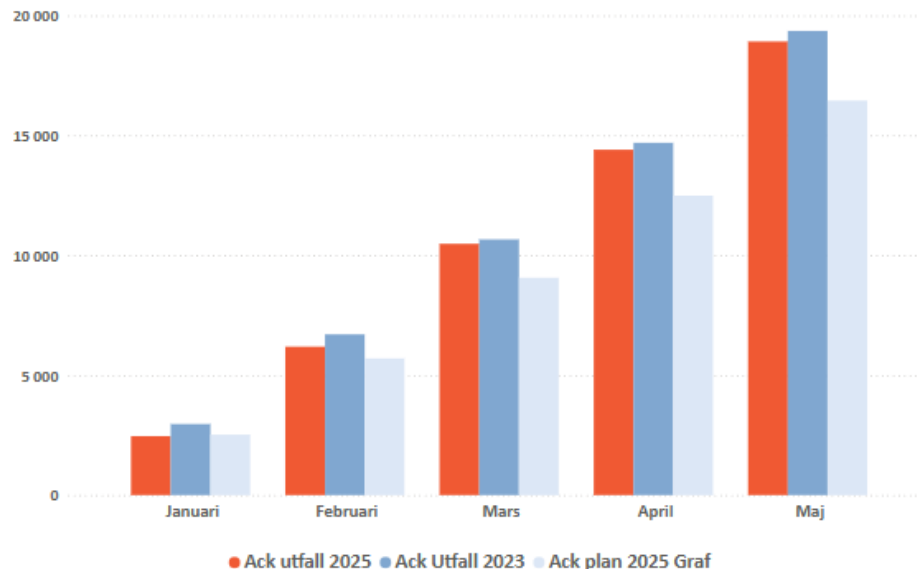
Resekostnader Utfall jmf plan -15%

Kostnaderna 2025 har minskat med 2,3 procent jmf med 2023